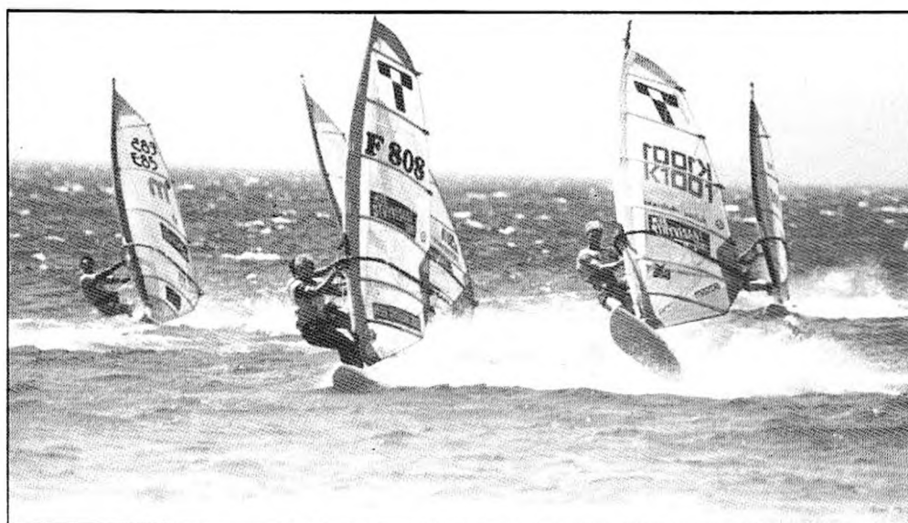
El nombre de Tarifa inevitablemente unido al del windsurfing

Y no se trata ya de windsurfistas, que ahora el viento no importa. Cada vez es mayor el turismo interior que llega a la población en verano, Navidades o Semana Santa, que se mezcla en un extraño todo con los músculos de bronce y rubios cabellos. O con las esculturas vivientes de suaves