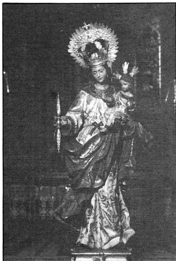
Virgen del Sol.

Tarifa. Y como a este patronazgo se asoció asimismo el referido y pujante gremio de mareantes, fue por lo que poco a poco, con el transcurso de los años, fueron extinguiéndose los cultos a la Virgen del Sol, aunque perdurando éstos dentro del espíritu religioso de la población.