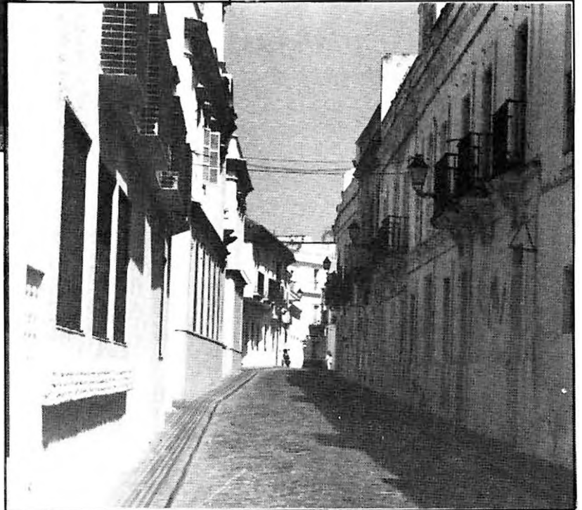
Calle de Guzmán el Bueno, la que fuera en su día calle del Coronel Valdés.