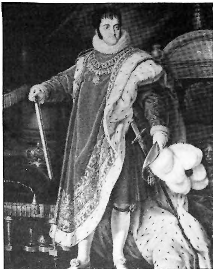
El absolutismo de Fernando VII propició la acción del Coronel Valdés.

Previamente se habían apoderado de la Isla