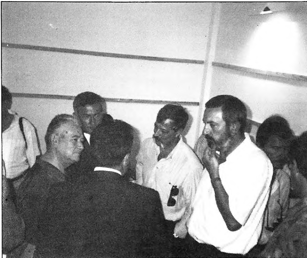
Momento de la clausura de la Exposición Filatélica.