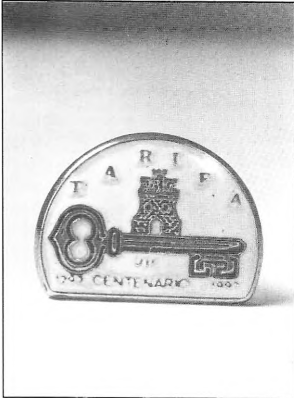
Insignias puestas a la venta, con el logotipo del VII Centenario.

Quizás ustedes se pregunten ¿qué pasará después del 21 de septiembre?. En cuanto respecta a la revista, ésta seguirá editándose (y