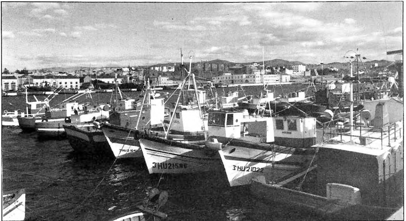
Puerto de Tarifa.