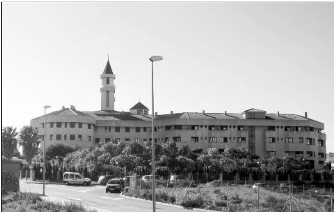
Imagen 3.- Residencia de ancianos de San García, en Algeciras.