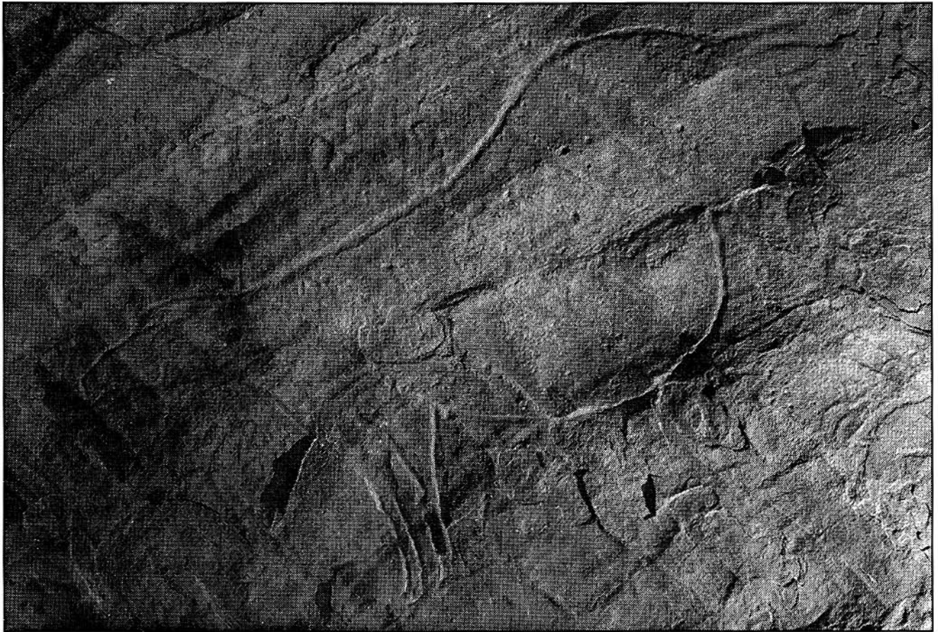
Fotografía del grabado de una yegua preñada.