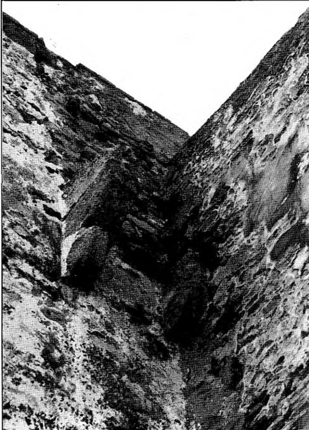
Restos de los canes que soportaban a una de las letrinas.

El Castillo de Tarifa se encontraba rodeado en su