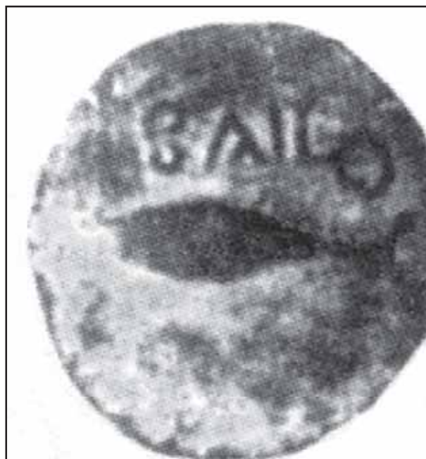
Fig. 3. Reverso de una acuñación de Bailo, con el nombre de la ciudad y el ícono del atún.

Desde fechas muy antiguas la ceca de Bailo abandonó sus producciones. De hecho, en el mismo siglo I a. C. entre las monedas de circulación local en la ciudad prácticamente ya no se encontra-