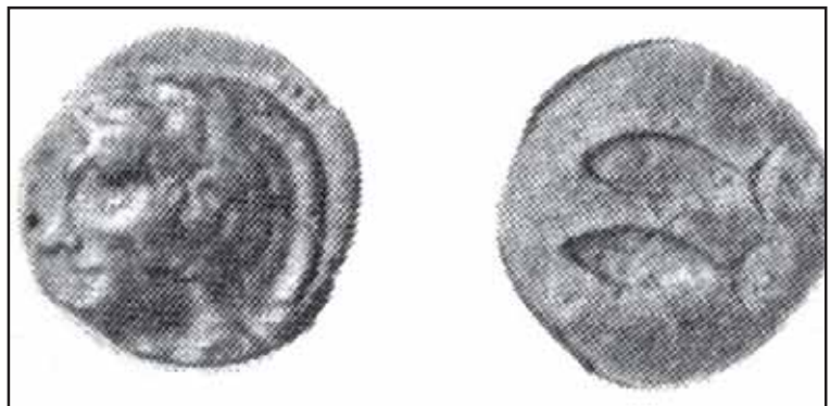
Fig. 1. Amonedaciones más antiguas de Cádiz, modelo para otras cecas hispanas posteriores.

Como después veremos, dicha moneda corresponde al Semis bilingüe que recogemos con el número 1: ya se detecta la doble leyenda en el anverso, la latina debajo de la espiga, y los tipos astrales encima del toro en el reverso. Florez proseguía señalando que en la Real Academia de la Historia existía otra moneda similar, aunque de cuño