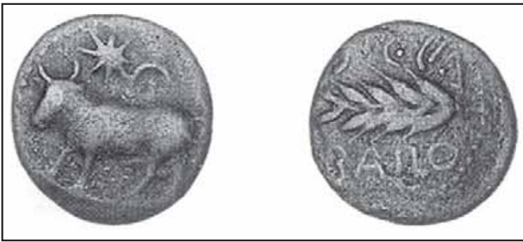
Fig. 4. Semis acuñado en Baelo con leyenda bilingüe. (Museo de Valencia de Don Juan).

ban las emisiones de Bailo, como demuestran los hallazgos realizados en las excavaciones efectuadas en Bolonia.