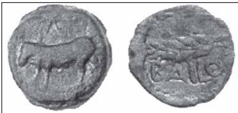
Fig. 8. Emisión de un As latino de la ceca de Bailo con letras exclusivamente latinas.

7. Emisión hipotética. Como hemos visto, el P. Florez en el siglo XVIII refería el hallazgo en Tarifa de otra moneda con el nombre de BAILO, y en el reverso el sol, un toro y una espiga, que consideraba de un tipo diferente (tipo actualmente desconocido). Este tipo hipotético mezclaría características de algunas de las emisiones. No obstante, al no conocerse actualmente la moneda debe considerarse una simple hipótesis. Pudo tratarse de un incorrecto testimonio, mezclando anverso y reverso.