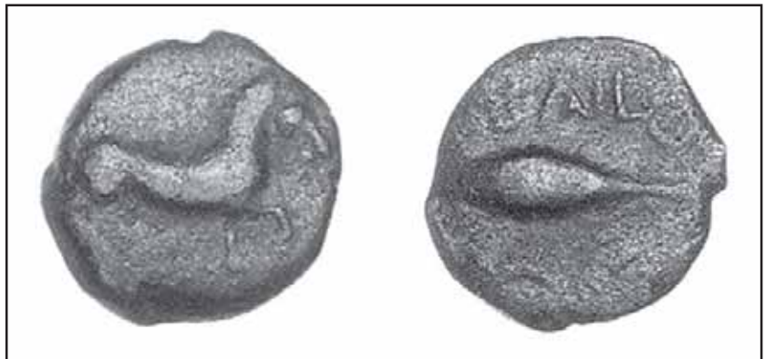
Fig. 9. Cuadrante acuñado por Bailo, con el caballo en el anverso y el atún en el reverso. (Instituto de Valencia de Don Juan).

6. La emisión con mayor diferencias de las restantes es la que en el anverso recoge un caballo al galope, hacia la derecha, y en el reverso un atún, encima del cual aparecen las letras latinas del nom-