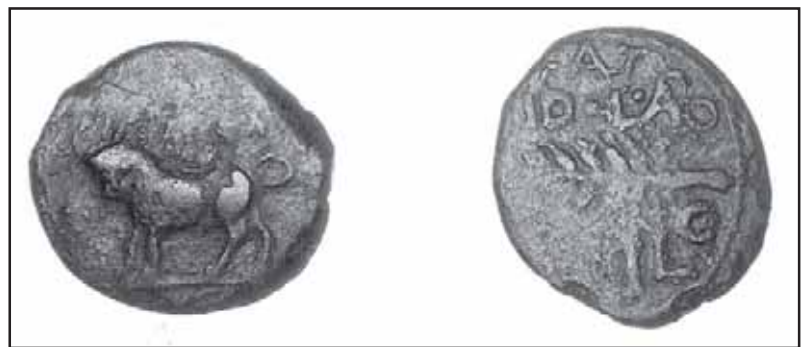
Fig. 7. Emisión de Semis de la ceca de Bailo. (Colección Sánchez de la Cotera).

De hecho, en las representaciones de las monedas tarifeñas encontramos símbolos que son característicos de la tradición religiosa púnica. De hecho la unión de la imagen del toro y la representación de la estrella representan tradicionalmente a Baal Hammon. La luna creciente con un punto era el símbolo característico de la diosa Tanit. Todo ello