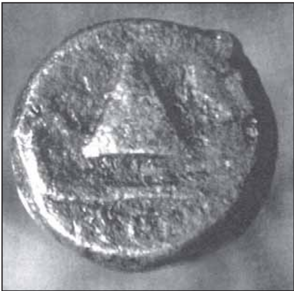
Fig. 10. Reverso del cuadrante que se postula como emisión fundacional del municipio de Baelo.

sobre báculo, y debajo una lectura muy borrada, que el autor interpreta como BAELO o BAILO.