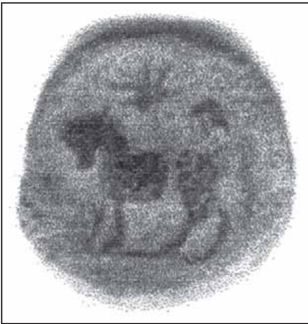
Fig. 6. Anverso de una moneda de Bailo, con el toro, el signo astral y el creciente lunar.

P. CORN que indica los nombres de los magistrados monetales (10). Probablemente es un símbolo de que, aunque continuara el uso de la lengua púnica, la elite dominante en la ciudad con bastante rapidez quiso dar muestras de la asimilación al poder romano y a su lengua.