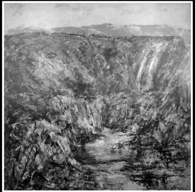
Imagen 1.- Cuadros de Vicente Rubio Tarifa.