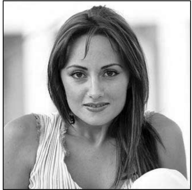
Imagen 3.- La cantante albanesa Eneda Tarifa.

dura comunista, siendo autor de libros apologéticos del régimen que estableció Enver Hoxa. Por último nombrar a Eneda Tarifa, una popular cantante en su país, una bonita voz que canta baladas con cierto aire floklórico.