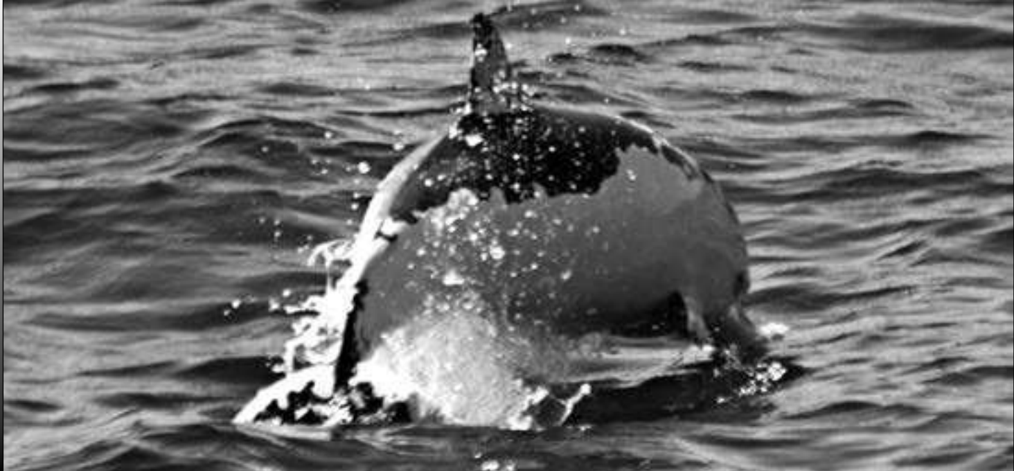
Figura 1.- Localización del delfín listado de coloración aberrante en cada uno de los dos avistamientos en el estrecho de Gibraltar.