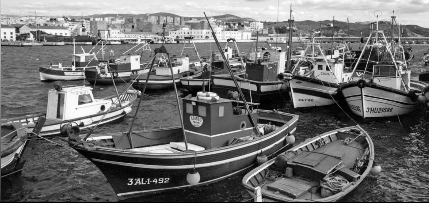
Imagen 1.- Barcos voraceros en el puerto de Tarifa.