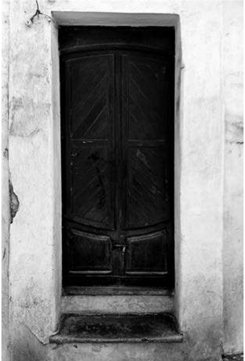
Figura 2.- Fachada de la antigua zapatería de Rafael Chamizo en la calle de La Luz.

Como anécdota podemos contar que su padre, una vez, compró un camión lleno de zapatillas de gomas y naturalmente, Tarifa se llenó de ellas. Sí, esas zapatillas que han llevado muchos tarifeños, el problema que tenían era que cuando sudaba el pie al caminar, la inestabilidad era bastante constante.