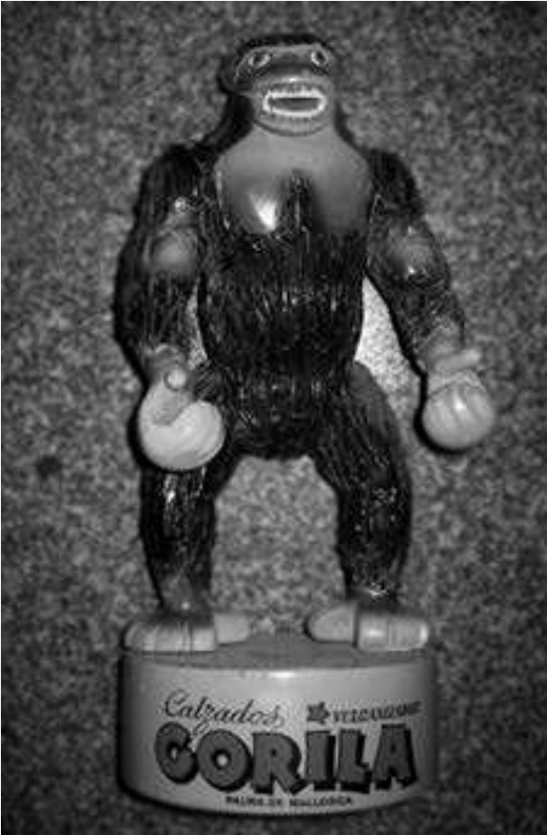
Figura 4.- Figura de los años 60, representativa de calzados Gorila.