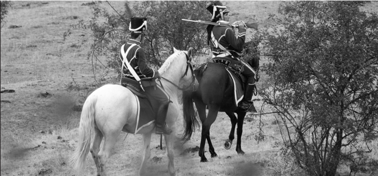
Imagen 1.- Cazadores a caballo pertenecientes al Ejército español, durante la recreación de una batalla de la Guerra de la Independencia.