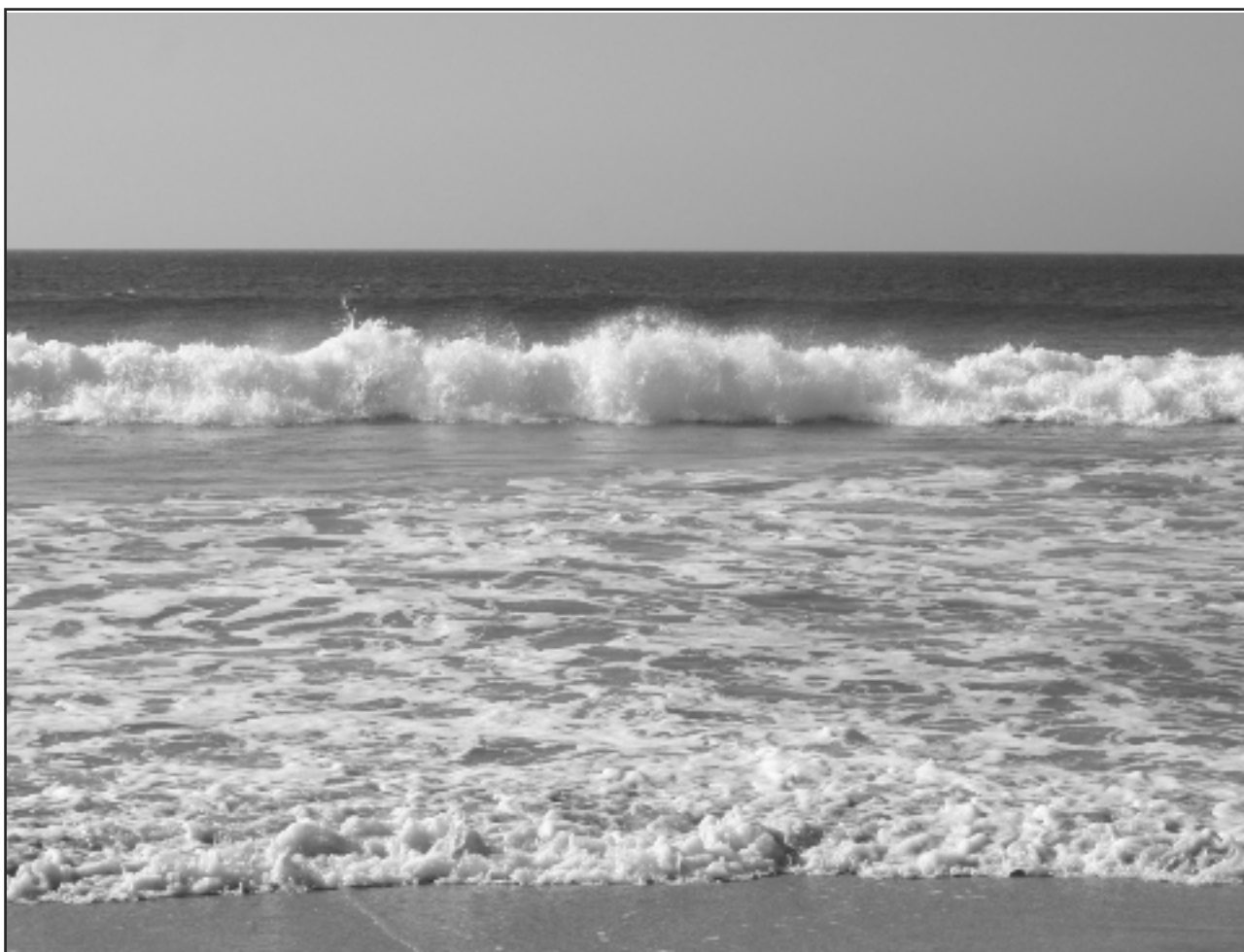
Imagen 2.- La playa de Los Lances, uno de los primeros parajes naturales creados en Andalucía.

Miguel y Manolo Blanco Morales quienes remodelaron la nave, para convertirla en bar de pescadores.