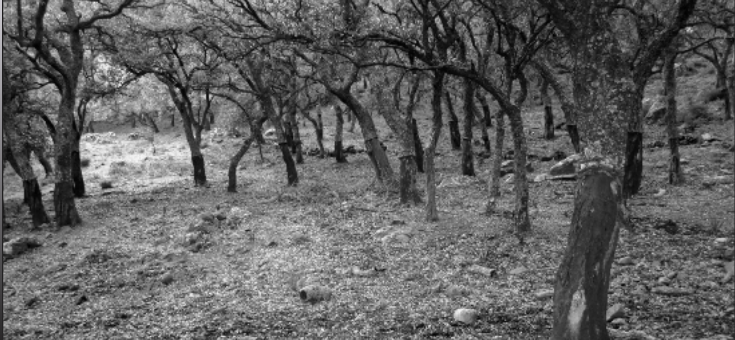
Imagen 1.-Parque Natural Los Alcornocales, creado en 1989.