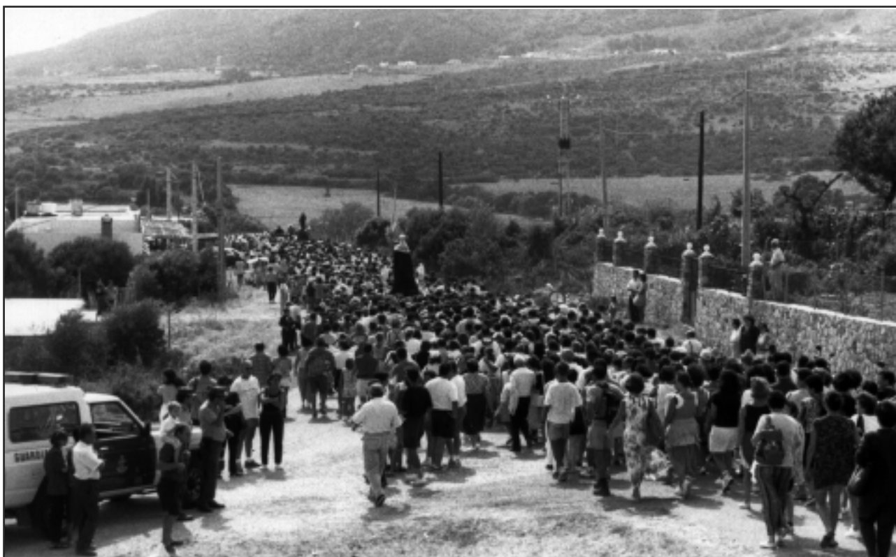
Imagen 3.- En 1989, la Patrona llegó a la ciudad sin Cabalgata Agrícola.

dan las cigüeñas en la cúpula del altar mayor.