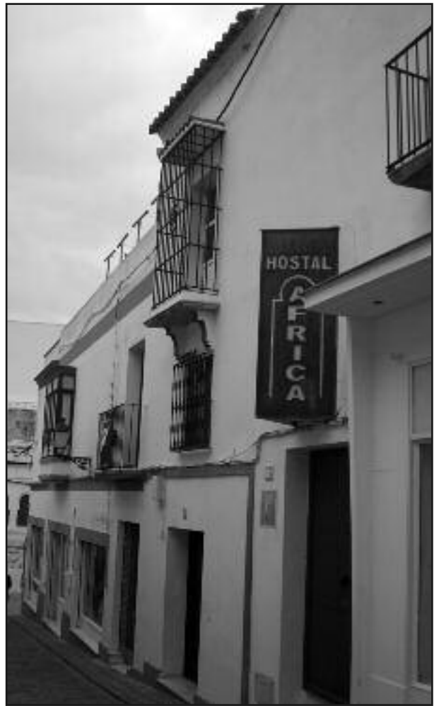
Imagen 4.- Vivienda que fue de la benefactora Doña María Antonia Toledo en la misma calle que lleva su nombre.

En cuanto a la vestimenta encontramos referencia tanto a la ropa interior “que será lo mas de cuatro mudas de ropa blanca, sagalejo, corpiño o monillo de ballesta morada u otro tejido según el tiempo lo pida”. Para el habito exterior señala que este “será talar con mangas anchas, de color carmelita obscuro, de estameña, sarga 19 u otro tejido semejante, con escapularios y manguillos de los mismos y lo ceñirán con una correa, toca y velo de lino y mantilla larga de ballesta del color del habito, zapatos abotonados”. Se trata pues de una indumentaria básica acorde con la pobreza que debían observar las esclavas y que debían manifestar igualmente en su aspecto físico de manera que “en el cabello que nunca lo tendrán muy largo no habrá rizos ni adornos, tenzuelas o vanidades semejantes tan disonantes de siervas de un Señor coronado de espinas”.