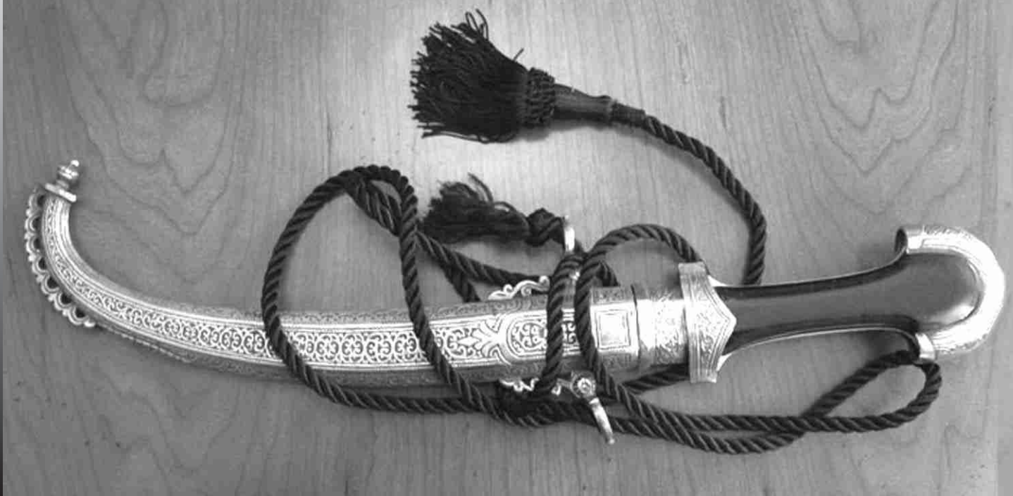
Imagen 1.- Gumia árabe.