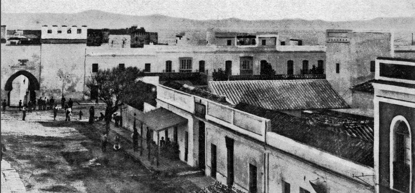
Imagen 1.- Una de las ilustraciones del libro.