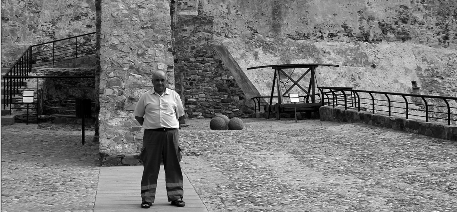
Figura 1.- Nuestro personaje posa en el castillo de Guzmán el Bueno, lugar que se conoce palmo a palmo.