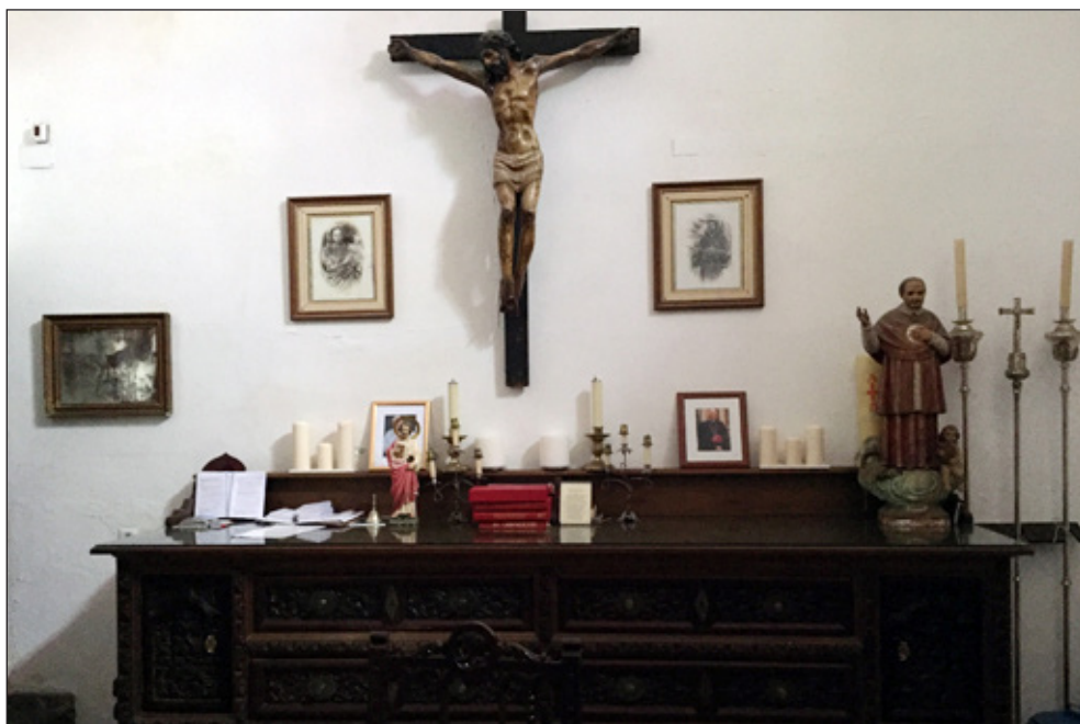
Figura 2.- Mueble y artes decorativas antiguas de la sacristía de San Francisco.

principales: 1º proporcionarles diariamente socorros pecuniarios si acreditan hallarse realmente enfermos y carecer de todo otro recurso; 2º costearles a todos sin distinción alguna un funeral de medias honras; y 3º aplicar ocho misas en sufragio del finado. Consta en la actualidad de 202 hermanos, y su estado económico es relativamente bueno, puesto que aparecen en su última liquidación de junio próximo pasado unas existencias de 5.464 reales 8 céntimos correspondientes al trimestre vencido en dicho mes. Según las prescripciones de los Estatutos, ha de reunirse la Junta Directiva mensualmente para examinar las cuentas, que han de presentarse por el Tesorero, extendiéndose las correspondientes actas en el libro que al objeto se lleva por la Secretaría.