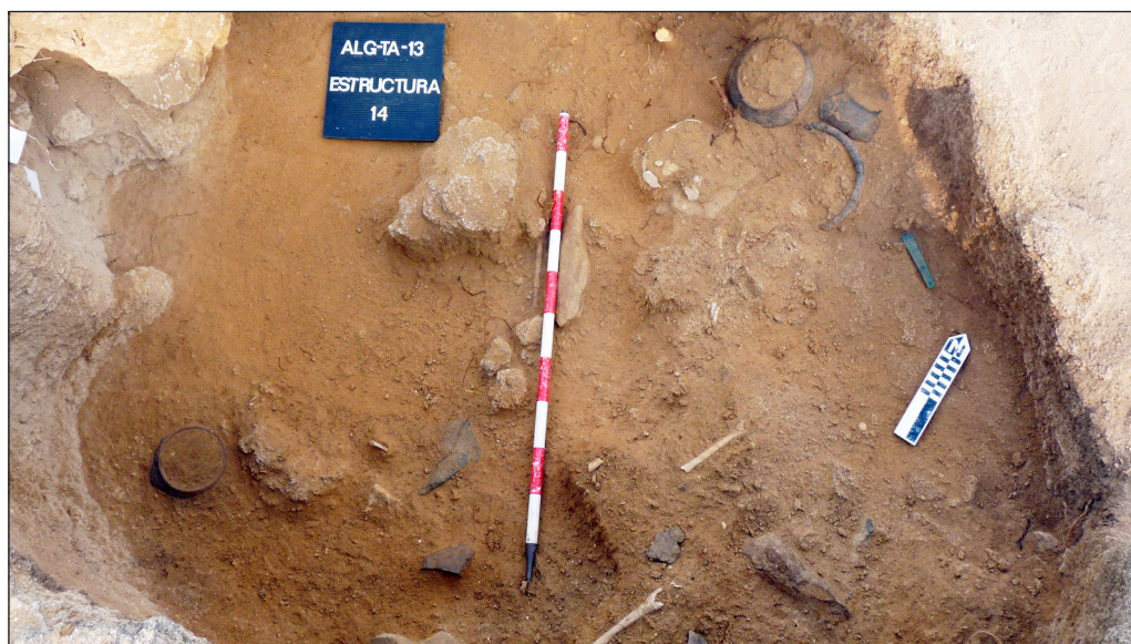
Figura 1.- Sepultura 14 “Los Algarbes” 2014.